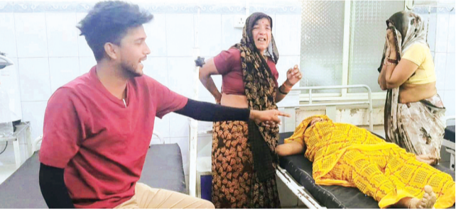
इंजेक्शन लगाया, जिससे महिला की तत्काल मौत हो गई। परिजनों ने पुलिस से आरोपी के खिलाफ सख्त से सख्त कार्रवाई की मांग की है।

चंदेरी नगर में स्वास्थ्य व्यवस्थाओं को ठेगा दिखाकर लोगों की जान से खिलवाड़ कर रहे एक डोलोछाप डॉक्टर की लापरवाही से एक और परिवार उजड़ गया। दांत निकलवाने गई एक महिला की गलत इंजेक्शन और बिना सूझबूझ के किए गए इलाज के कारण मौत हो गई। प्रशासन ने मामले की गंभीरता को देखते हुए आरोपी डॉक्टर की क्लीनिक को सील कर दिया है।