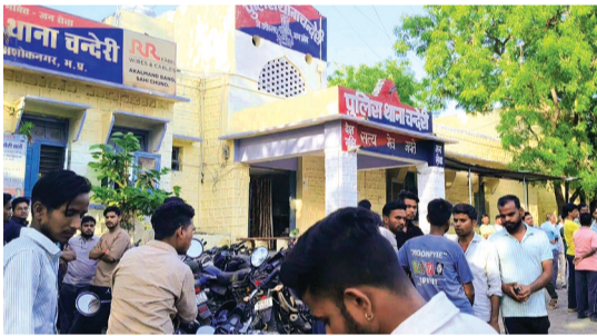
हरिभूमि न्यूज | अशोकनगर

चंदेरी नगर में स्वास्थ्य व्यवस्थाओं को ठेगा दिखाकर लोगों की जान से खिलवाड़ कर रहे एक डोलोछाप डॉक्टर की लापरवाही से एक और परिवार उजड़ गया। दांत निकलवाने गई एक महिला की गलत इंजेक्शन और बिना सूझबूझ के किए गए इलाज के कारण मौत हो गई। प्रशासन ने मामले की गंभीरता को देखते हुए आरोपी डॉक्टर की क्लीनिक को सील कर दिया है।