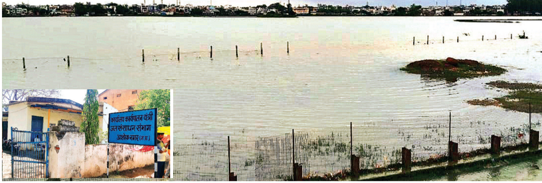
2016 से नगरपालिका को हस्तारित करने की प्रक्रिया चल रही है जो आज भी अधूरी

सीमांकन को लेकर आधा दर्जन पत्र हो चुके हैं जारी सीमांकन को लेकर विभाग द्वारा आधा दर्जन पत्र जारी किए जा चुके हैं, लेकिन सीमांकन का कार्य नहीं हुआ है। उन्होंने बताया कि जल संसाधन विभाग द्वारा इस तालाब के निर्माण को लेकर बड़ी राशि खर्च की गई थी, भू अर्जन की कार्यवाही भी हुई थी, विभाग